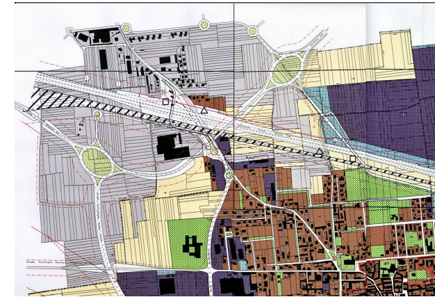
COMUNE DI ROMENTINO: ESTRATTO DEL P.R.G.C. 2003 VARIANTE N.2